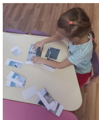
Рис. 3, 4. Дидактические игры «Только вперед!» и «Военная техника»