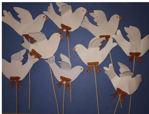
Рис. 9. Детские работы «Голубь мира»