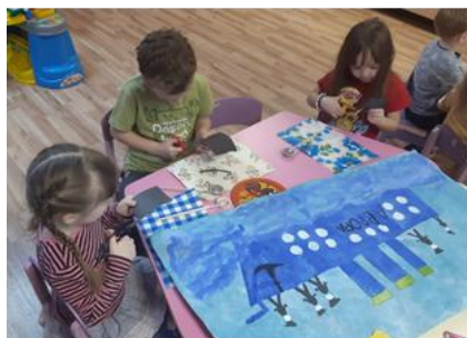
Рис. 5. Рисование «Матросы боевого корабля»

бумаги, аппликация, лепка. Прослушивание музыкальных произведений «Священная война», «День Победы», «Катюша», «Прощание славянки».