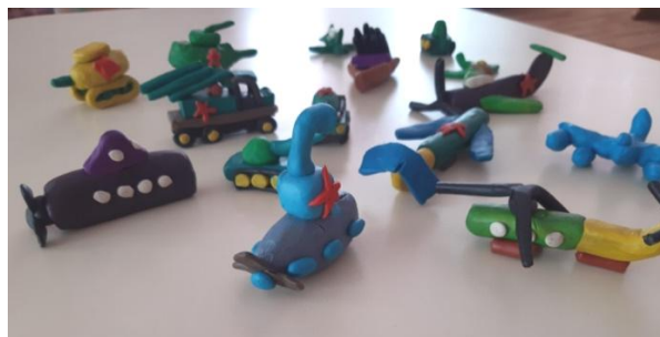
Рис. 6. Лепка «Военная техника»

Физическое развитие: спортивный праздник «Мы тоже в армию пойдём!»; подвижные игры «Кто быстрее, тот командир», «Кавалеристы», «Сапёры», «Связисты», «Разведчики», «На границе».