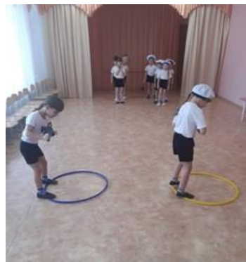
Рис. 7. Совместное мероприятие с физинструктором «Мы тоже в армию пойдём!»