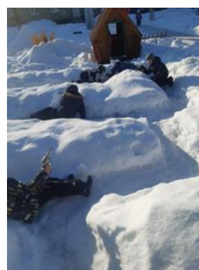
Рис. 1, 2. Сюжетно-ролевые игры «Помоги раненому» и «Разведчики»