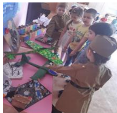
Рис. 8. Ознакомление дошкольников ДОУ с инсталляцией