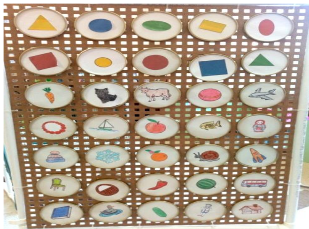
Рис. 2. Секция № 1 «Крышечки»

Секцию можно использовать для дидактических игр: