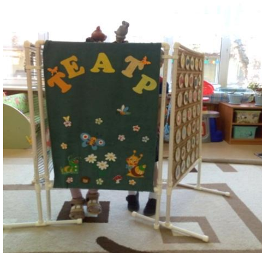
Рис. 3. Секция № 2 «Театр»

Вторая секция ширмы «Театр» (рис. 3) может использоваться в совместной организованной деятельности или в самостоятельной деятельности детей, предназначена для показа театрализованных постановок с разными видами кукол, а также для сюжетно-ролевых игр. В этих видах деятельности наблюдается интеграция всех образовательных областей: социально-коммуникативное развитие, художественно-эстетическое, речевое, познавательное, физическое развитие (например, пальчиковый театр).