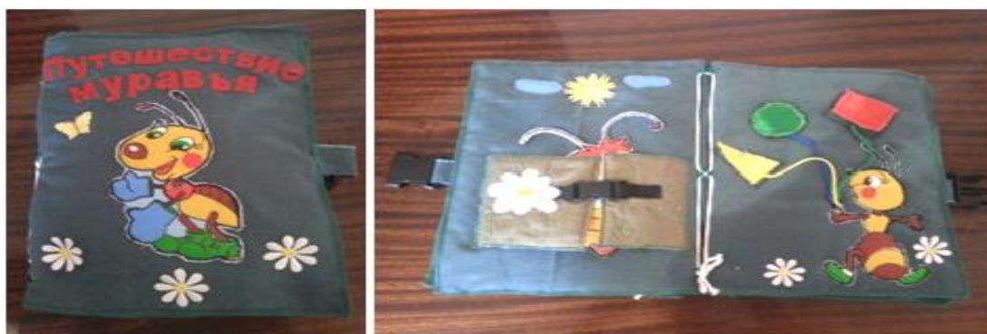
Рис. 1. Дидактическая игра «Путешествие муравья»

Многофункциональное пособие «Ай да я!» представлено в виде ширмы с тремя независимыми секциями, несущими различную смысловую нагрузку. Секции изготовлены из полипропиленовых труб, соединённых между собой в виде рам. К рамам крепятся съемные полотнища из ткани – они закрепляются на тесьму-липучку. Имеются дополнительные элементы к сюжетно-ролевым играм или украшения, которые также крепятся к полотнам ширмы на тесьму-липучку.