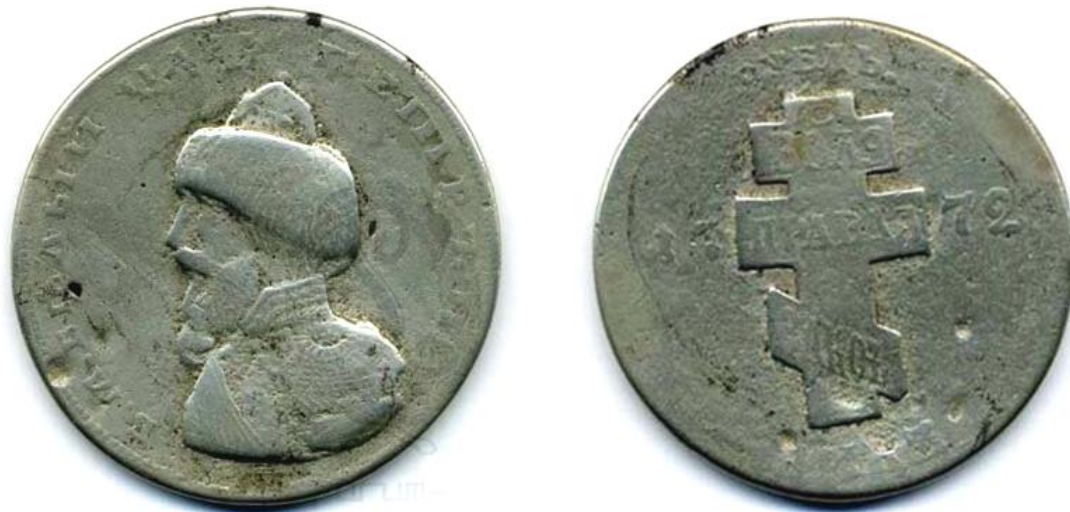
Серебряный рубль Петра III (Е. Пугачева)