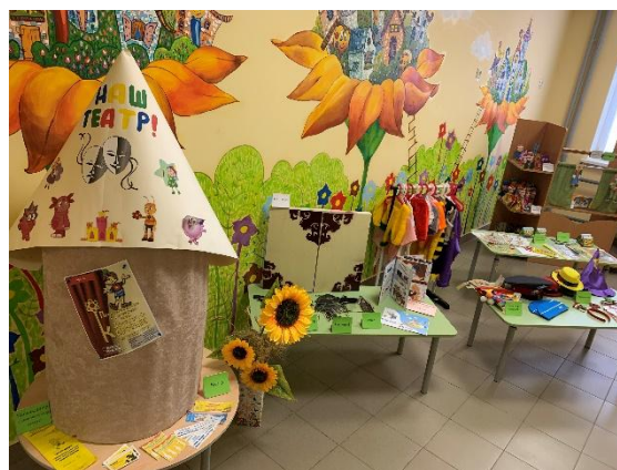
Рис. 3. Зона знакомства с театральными профессиями

Кроме систематически организовывающихся выставок, музеев и экскурсий, во внегрупповых помещениях дошкольного образовательного учреждения оформлены стационарные зоны, которые стимулируют познавательную активность и знакомят дошкольников с различными профессиями.