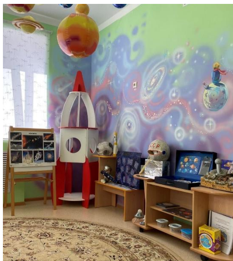
Рис. 1. Центр знакомство с профессиями космического кластера

Педагоги совместно с родителями организовали внутри групп центры, в том числе и мобильные, ориентированные на знакомство с профессиями в первую очередь по направленности группы (рис. 1). Именно эта работа и стала первым этапом на пути к дальнейшему использованию пространства вне групп.