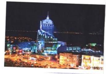
Рис. 2. Места, которые привлекают туристов в нашей стране.

The 3rd place in Russia I recommend you to is my home city Samara. It is situated on a very beautiful river - the Volga. And I think it would be better to come to Samara in summer when it looks like a resort city. You can go to the beach or go hiking. There are some interesting sightseeing too, and it would be my pleasure to show you around. Just don't forget to bring your camera with you - 'coz you can take a lot of great pictures.