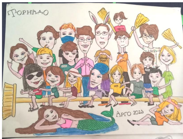
Рис. Мастер-класс «Шарж моего отряда»

В процессе коллективно-творческих дел (см. рис.) происходит укрепление чувства товарищества, стимулирование трудовой активности, выработка жизненной позиции, формирование норм поведения в обществе. Именно там ребенку проще формировать уважительное отношение к себе.