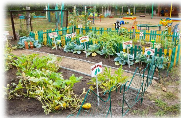
Рис. 3. Огород