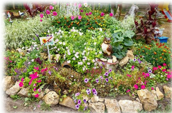
Рис. 5. Альпийская горка