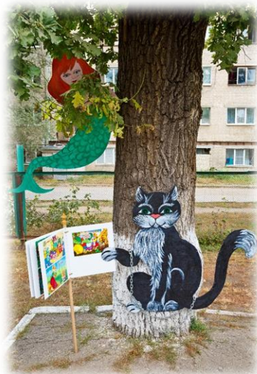
Рис. 6. Ученый кот

На каждом участке детей встречают герои любимых сказок: Красная Шапочка, Ученый кот, Колобок, Буратино и другие (рис. 6). Общение с героями способствует обогащению активного словаря, развитию диалогической речи и речевого творчества.