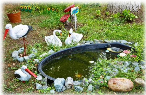
Рис. 4. Водоем

На территории детского сада появилась «Экологическая тропа»: солнечные часы, птичий столб, зеленая аптека, водоемы, экологические знаки, цветники, каштановая аллея, хвойники, уголок нетронутой природы и пр. (рис. 4, 5). Все это развивает любознательность, позитивную мотивацию детей, повышает экологическую грамотность.