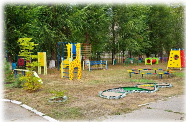
Рис. 1. Спортивная площадка

Большое внимание на территории ДООУ уделено трудовому воспитанию. Работа на огороде, цветниках, альпийской горке, уход за зелеными насаждениями – все это формирует позитивное отношение к труду (рис. 3).