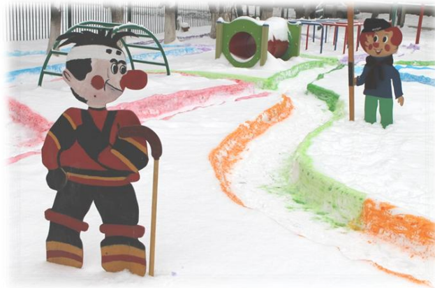
Рис. 9. Снежный лабиринт

В городском конкурсе на лучшее новогоднее оформление прилегающих территорий мы стали победителями в номинации «Сказка входит в каждый дом».