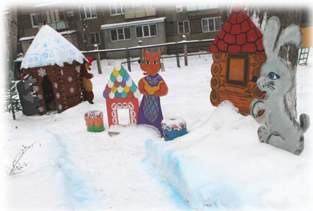
Рис. 8. Герои любимых сказок

Развитию двигательной активности способствуют: снежные лабиринты, проложенная лыжня, снежные горки, расчищенные площадки для проведения зимних игр и забав (рис. 9).