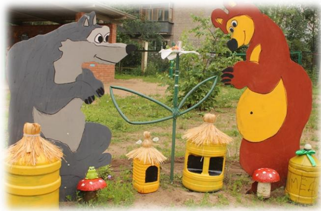
Рис. 2. «Пасека»