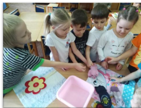
Рис. 3. Экспериментирование «Ткани всякие нужны»