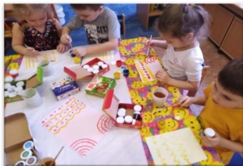
Рис. 4. Рисование «Мы дизайнеры ткани»