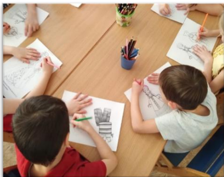
Рис. 2. Работа с раскрасками «Мода бала»