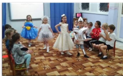
Рис. 7. Модное дефиле