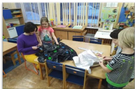
Рис. 6. Изготовление совместно с родителями нарядов разных эпох

По итогам проекта прошло модное дефиле «Мода разных эпох», где дети продемонстрировали созданные ими совместно с родителями костюмы.