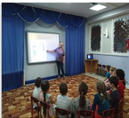
Рис. 1. НОД «Мода разных эпох»