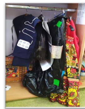
Рис. 9. Костюмы