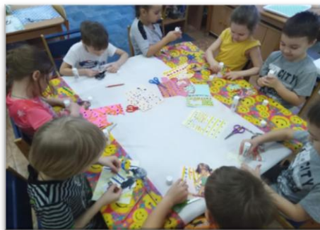
Рис. 5. Аппликация «Мы дизайнеры одежды»