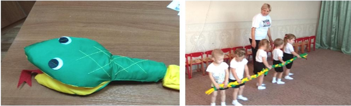
Рис. 7. Трансформация «Змейка»

Игровые задания: ходьба и бег со змейкой в руках, перепрыгивание через змейку, лежащую на полу, ходьба по змейке боком, приставным шагом.