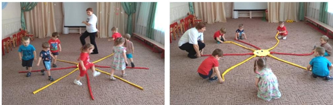
Рис. 5. Игровые задания: перешагивание через лучики и приседание с лучиком в руках