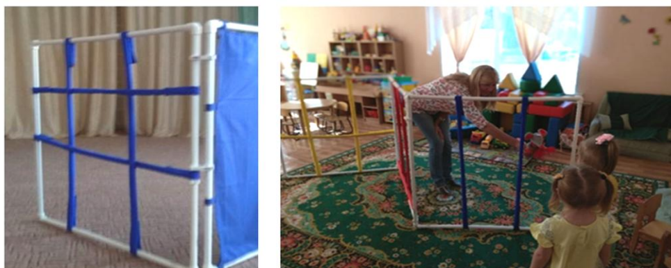
Рис. 4. Варианты использования разноцветных полосок, закрепленных на ширму-трансформер

Полоски могут служить хорошим дополнением к универсальной ширме-трансформеру. Они крепятся по периметру ширмы в разных направлениях: вертикально натянутые на ширме (воротики или забор) используются для пролезания боком между полосками, натянутые горизонтально – для перешагивания и подлезания; натянутые горизонтально и вертикально (клетки) – для подлезания и метания (рис. 4). Для детей постарше можно сделать из полосок паутину и прикрепить на ней колокольчик. Такие задания вызывают у детей массу положительных эмоций, развивают ловкость и координацию движений.