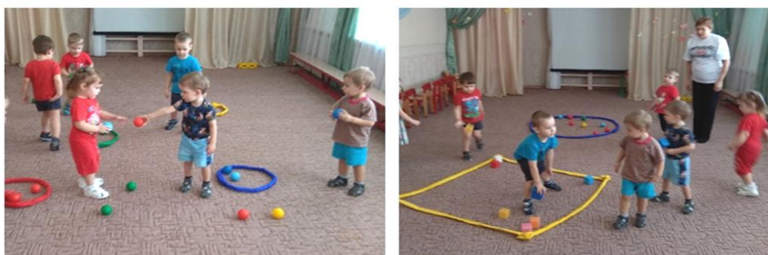
Рис. 6. Игра «Найди домик»

Игровое задание: шарики и кубики потеряли свой домик, нужно помочь им найти его; шарики живут в круглом домике, кубики – в квадратном.