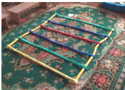
Рис. 1. Лесенка из разноцветных полосок

Для развития двигательной активности детей раннего дошкольного возраста мы используем пособие «Разноцветные полоски». Оно представляет собой сшитые из плащевой ткани и синтепона объемные полоски четырех цветов (красного, желтого, синего, зеленого) с текстильной липучкой (лентой велкро) на конце. Пособие легко изготовить, за ним легко ухаживать, оно безопасное, яркое, легко трансформируемое и компактное. С разноцветными полосками можно придумать множество игр и заданий. Полоски могут скрепляться в кольцо и между собой в разных вариантах, использоваться как самостоятельное пособие для развития движений, организации подвижных игр (рис. 1), игр на усвоение сенсорных эталонов или комбинироваться с многофункциональной ширмой (рис. 2).