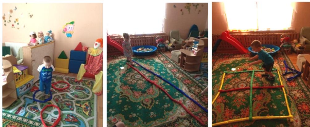
Рис. 3. Варианты трансформации: колечки, дорожка, классы

Полоски могут служить хорошим дополнением к универсальной ширме-трансформеру. Они крепятся по периметру ширмы в разных направлениях: вертикально натянутые на ширме (воротики или забор) используются для пролезания боком между полосками, натянутые горизонтально – для перешагивания и подлезания; натянутые горизонтально и вертикально (клетки) – для подлезания и метания (рис. 4). Для детей постарше можно сделать из полосок паутину и прикрепить на ней колокольчик. Такие задания вызывают у детей массу положительных эмоций, развивают ловкость и координацию движений.