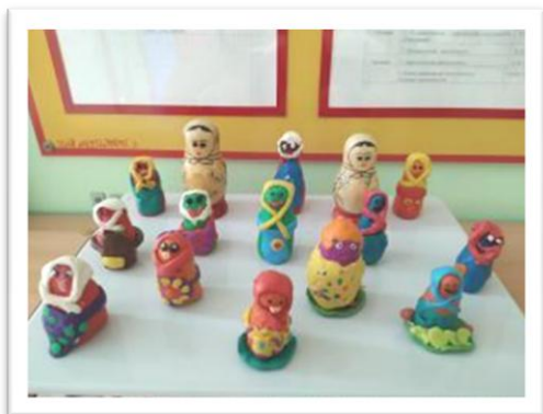
Рис. 3. Матрешки, выполненные воспитанниками

Первые экспонаты нашего мини-музея были сделаны руками родителей на мастер-классе «Матрёшка – символ России».