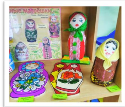
Рис. 6. Атрибуты раздела «Сделай сам»

Раздел «Библиотека» – собраны загадки, стихи, рассказы, сказки о матрёшках, которые могут быть использованы в ООД и самостоятельной игровой детской деятельности.