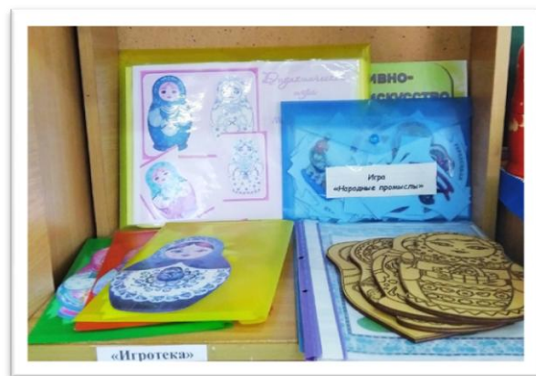
Рис. 8. Атрибуты раздела «Игротека»