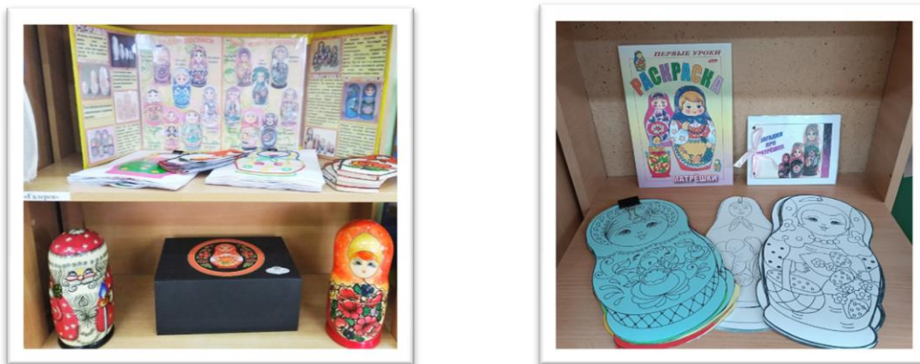
Рис. 9. Атрибуты раздела «Галерея»

Раздел «Галерея» содержит творческие работы детей: рисунки, поделки, которые периодически обновляются.