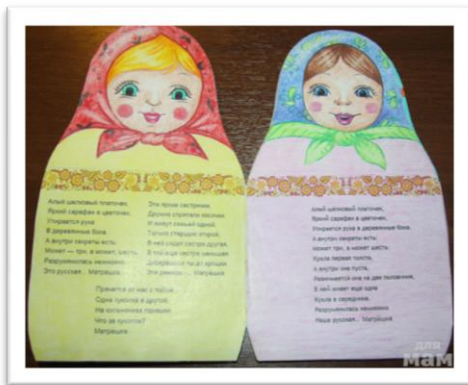
Рис. 7. Атрибуты раздела «Библиотека»

Раздел «Библиотека» – собраны загадки, стихи, рассказы, сказки о матрёшках, которые могут быть использованы в ООД и самостоятельной игровой детской деятельности.