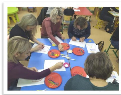
Рис. 4. Мастер-класс для родителей «Матрёшка – символ России»