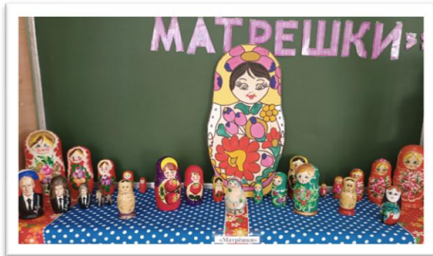
Рис. 5. Атрибуты раздела «Матрёшки»

Раздел «Сделай сам» содержит экспонаты сделанные руками детей, родителей и педагогов. Данные экспонаты также могут быть использованы в игровой детской деятельности и ООД.