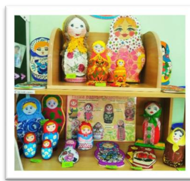
Рис. 2. Экспозиция матрешек, выполненных в различных видах народной и авторской росписи

Изучение народных промыслов носит творческий характер: ребята рассматривают узоры, а затем на занятиях по художественно-эстетическому развитию применяют их на практике.