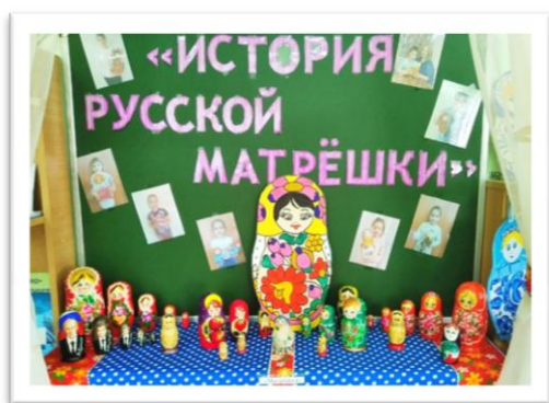
Рис. 1. Центральная экспозиция, виды матрешек

Приобщая воспитанников к музейной коллекции, педагоги получили возможность познакомить их не только с семеновской матрёшкой, но и с изделиями гжельских, филимоновских, городецких мастеров, с жостовской и костромской росписью.