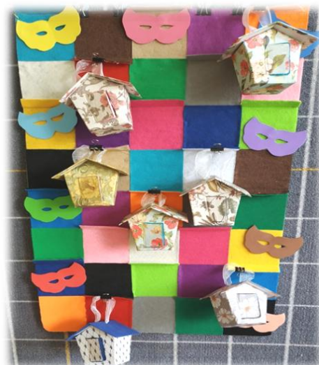
Рис. 5. Адвент-календарь к Всемирному дню театра

Игра «Товар или услуга» позволяет закрепить представления о данных экономических понятиях на примере театральных профессий. Например, результат деятельности актёра, гримёра – услуга, а костюмера, художника, декоратора – товар. Задания могут быть разнообразными, помогающими создать образовательные ситуации по ознакомлению детей с конкретными профессиями, продемонстрировать возможные связи между ними. Например, игры с кругами Луллия «Найди отличия», «Что общего».