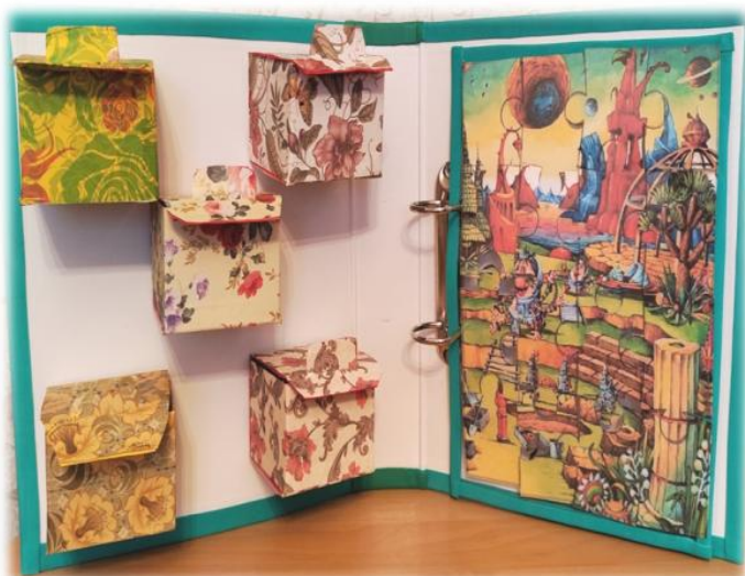
Рис. 4. Адвент-календарь ко Дню космонавтики