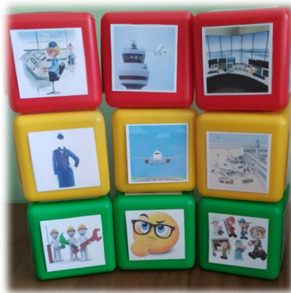
Рис. 1. Кубики историй по теме «Профессии»

3. На третьем этапе составляем предложения и рассказы (сказки).