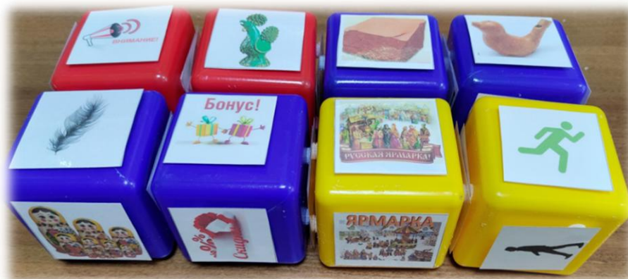
Рис. 2. Кубики историй по теме «Реклама абашевской игрушки»

Для сочинения рекламы игрушек используем следующие кубики: красный – товар, который рекламируем, жёлтые – характеристика или описание (размер, форма, материал, цвет), качества или свойства (гибкий, прочный, развивающий, мягкая), назначение (для семьи, девочек, мальчиков), производитель, цена (скидка, подарок, бонус, акция), зелёный – действие (звони, приходи, действуй, напиши).