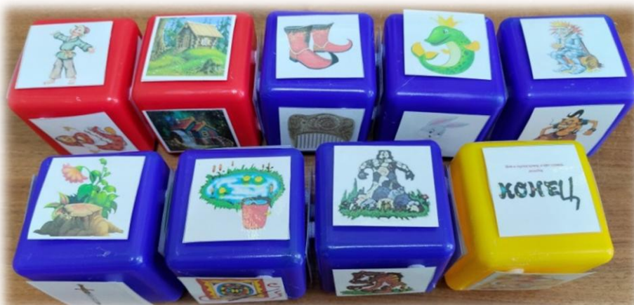
Рис. 3. Кубики историй по теме «Сказки»

Используя кубики историй, можно сочинять финансовые сказки, применяя уже известный алгоритм. Согласно картам В. Я. Проппа и жанровым особенностям сказки, подбираем следующие кубики: главный герой, место действия, волшебный предмет, герой-помощник, отрицательный персонаж, задание или испытание, превращение, концовка.