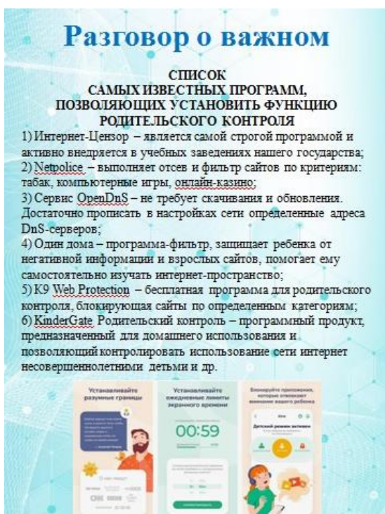
Рис. 2. Список программ, позволяющих установить функцию родительского контроля