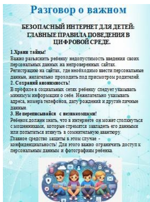
Рис. 1. Безопасный Интернет для детей: главные правила поведения в цифровой среде

1. Разговор о важном. В данном разделе электронного журнала размещаются рекомендации, советы, консультации для родителей по вопросам цифровой безопасности (рис. 1–3).