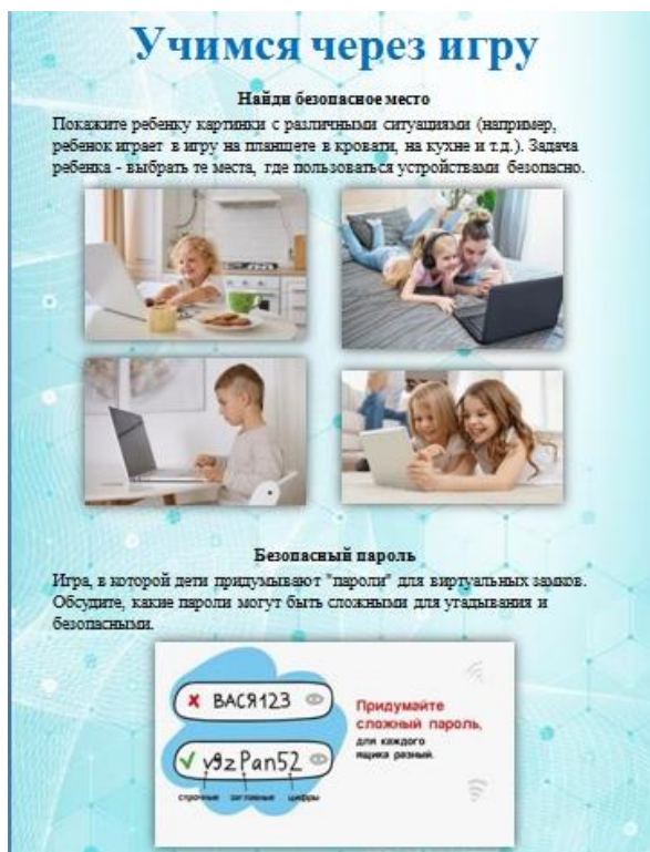
Рис. 6. Игра «Найди безопасное место»