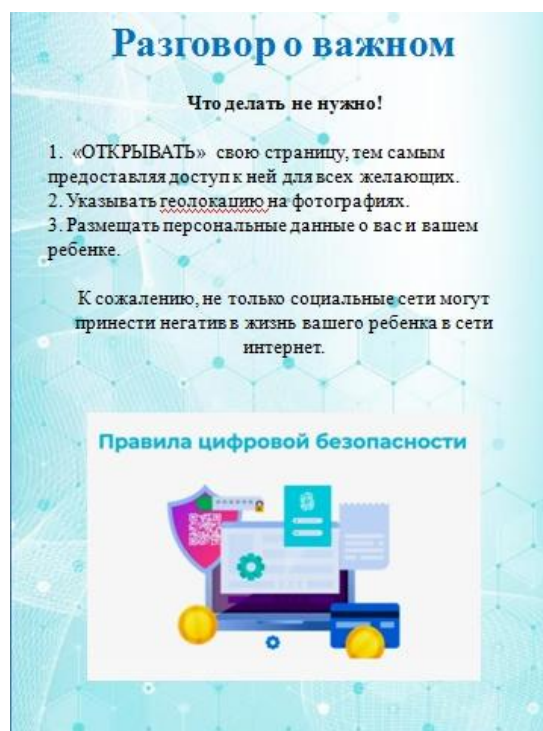
Рис. 3. Рекомендации для родителей

2. Читаем вместе. В данном разделе размещаются короткие тексты рассказов и сказок для дошкольников. К тексту прилагаются вопросы по содержанию и иллюстрации.