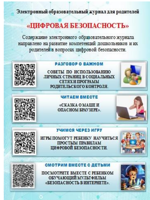
Рис. 9. Печатный вариант журнала