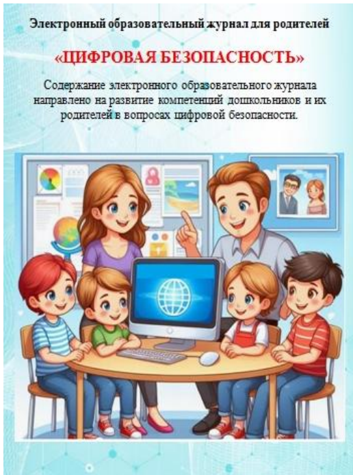
Рис. 8. Электронный вариант журнала