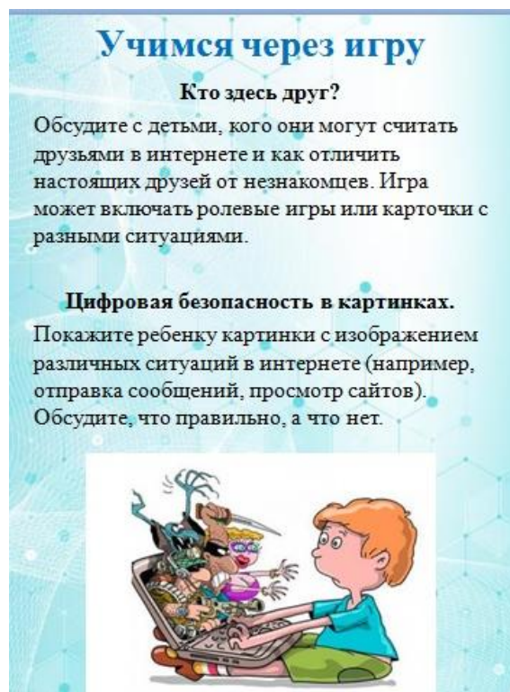
Рис. 7. Игра «Кто здесь друг?»

4. Смотрим вместе с детьми. В данном разделе журнала (раздел присутствует только в печатном варианте) размещаются обучающие видеоролики для дошкольников (социальные видео- и мультипликационные фильмы).