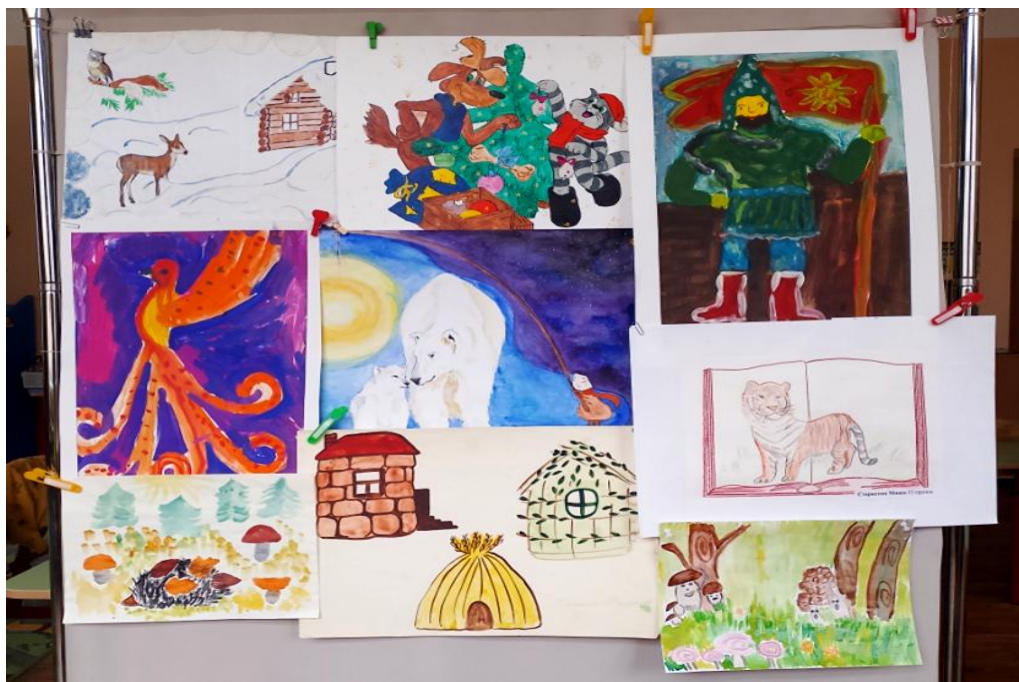
Рис. 4. Выставка иллюстраций

Для развития у детей памяти, речи, мышления мы использовали дидактические игры «Путешествие по басням Крылова», «Положительный и отрицательный герой».