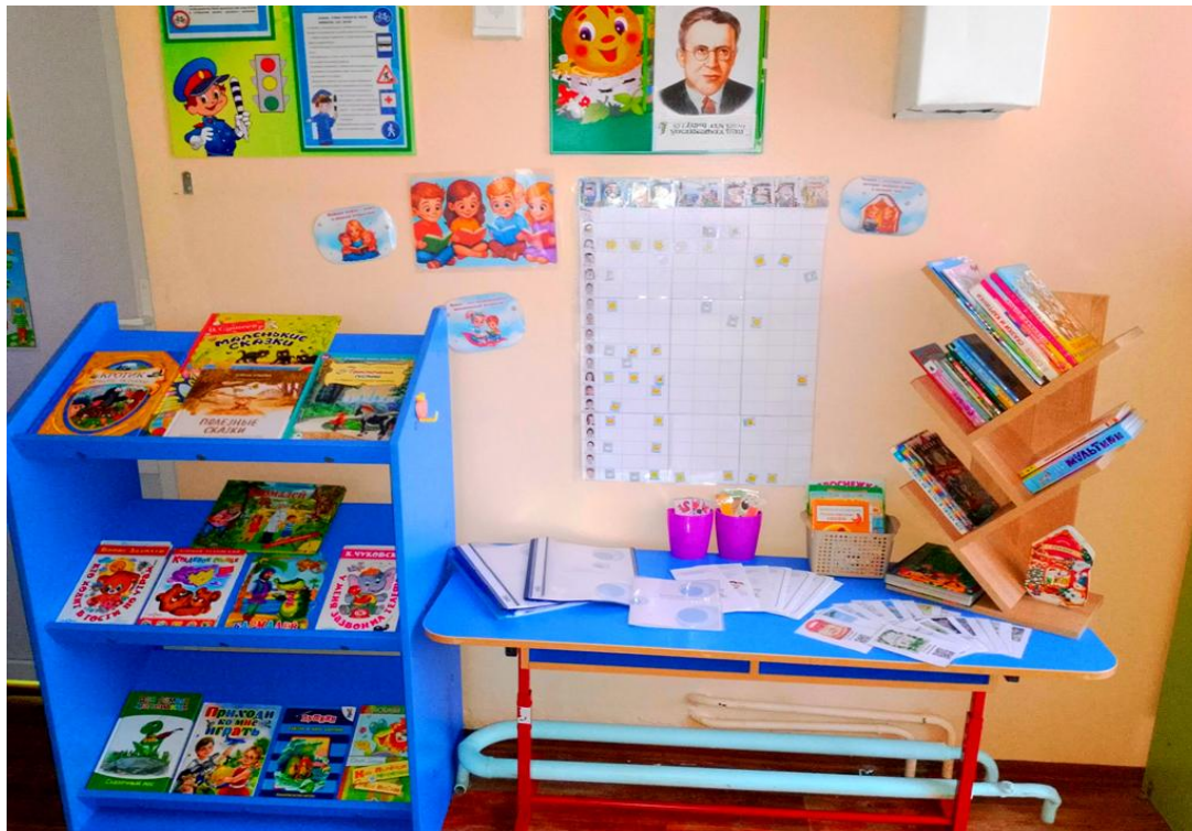
Рис. 1. Читательский уголок

Далее приступили к созданию безопасного уголка по обмену книгами в группе, включающего в себя полку, стол для просмотра книг, экран фиксирования прочитанных книг.