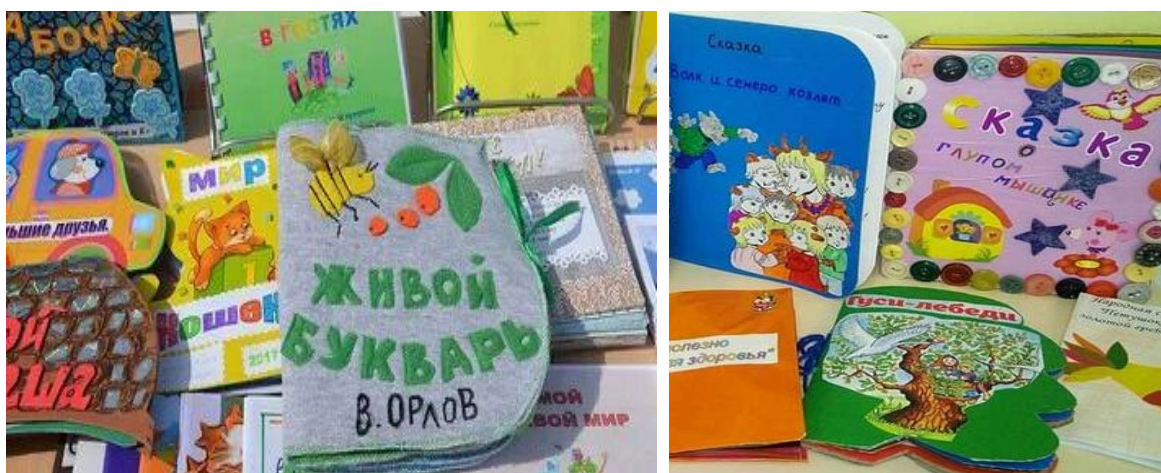
Рис. 3. Книжки-малышки

Самые активные родители вместе с детьми после прочтения сказок изготовили авторские книжки-малышки.