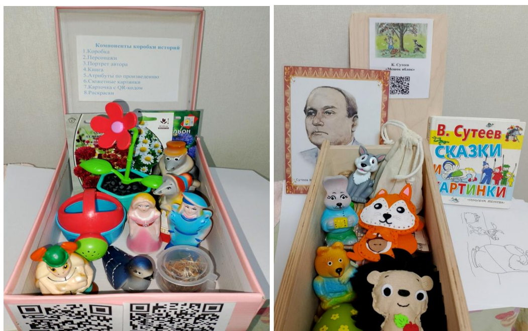
Рис. 5. «Коробки историй»

Реализация проекта показала, что совместная работа объединяет родителей, детей и педагогов общими интересами, впечатлениями, эмоциями, способствует формированию интереса к книге, появлению у детей желания читать.