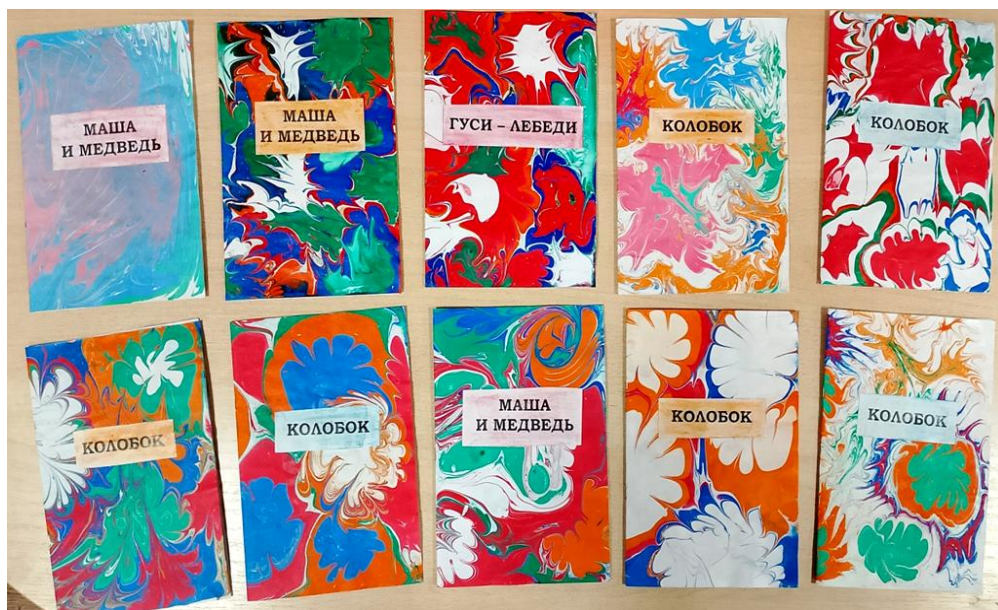
Рис. 3. Акварисование

Самые активные родители вместе с детьми после прочтения сказок изготовили авторские книжки-малышки.