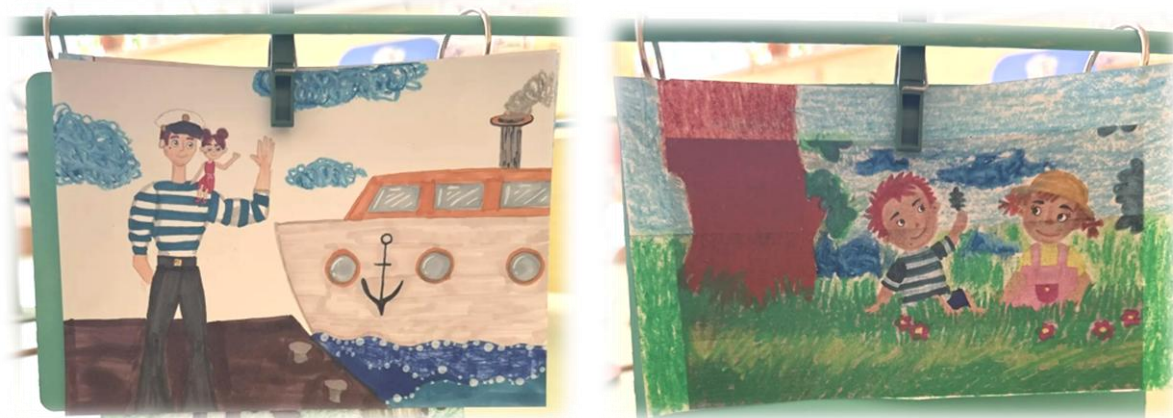
Рис. 3. Просмотр

Для эффективности просмотра обязательно предлагаем родителям «Алгоритм подготовки к просмотру и беседе» (вопросы для беседы с ответами) и «Алгоритм впечатлений» (варианты совместных занятий после просмотра). Они также содержатся в «Помогаторе». Например, предложили посмотреть мультфильмы «Яблочки-пятки» и «Папа большой, я маленькая» с алгоритмами подготовки и впечатлений, с играми и творческими работами на неделе «Мой любимый папа»; мультфильмы «Волшебные слова», «Любознашки», «Бумбарашки», «Цветняшки», сделать свои мультфильмы по сочинённой сказке «Ни дня без волшебного слова» на неделе «Наши добрые дела».