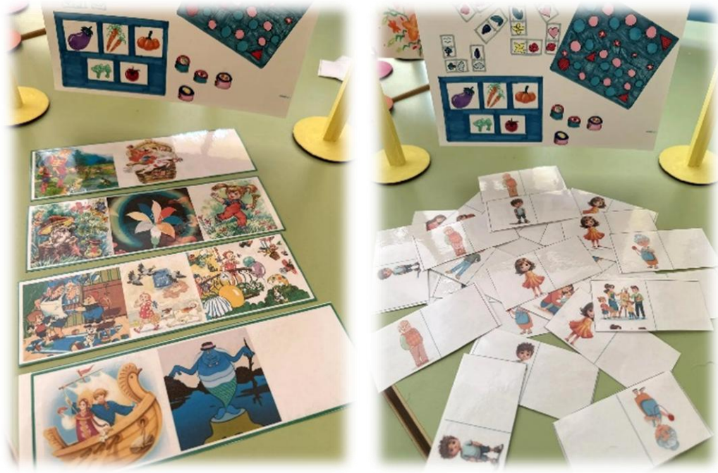
Рис. 7. Мастерская

В дальнейшем планируем разработать еще одну часть календаря – карту России для знакомства с городами, их историей, традициями и творчеством народных мастеров.