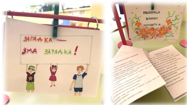
Рис. 4. Рассуждение

Четвертая часть календаря – рассуждение – это обсуждение пословиц и поговорок по теме, отгадывание и составление загадок с последующей зарисовкой и созданием книжек-малышек. Загадка – один из древнейших способов познания и осмысления мира. Она учит мыслить нестандартно, развивает интеллектуальные способности. Особо ценно, что совокупность сведений о природе и человеческом обществе постигается ребёнком в процессе активной мыслительной деятельности. Для составления загадок разработаны карты-подсказки. Обсуждали пословицы о семье и отце, создали книжки-малышки с пословицами в картинках на неделе «Мой любимый папа». Обсуждали пословицы о ценности слов благодарности и добра, сделали книжки в форме сердечка с пословицами в картинках в течение недели «Наши добрые дела». Творческие работы создаются как в саду во время мастерских, так и дома.