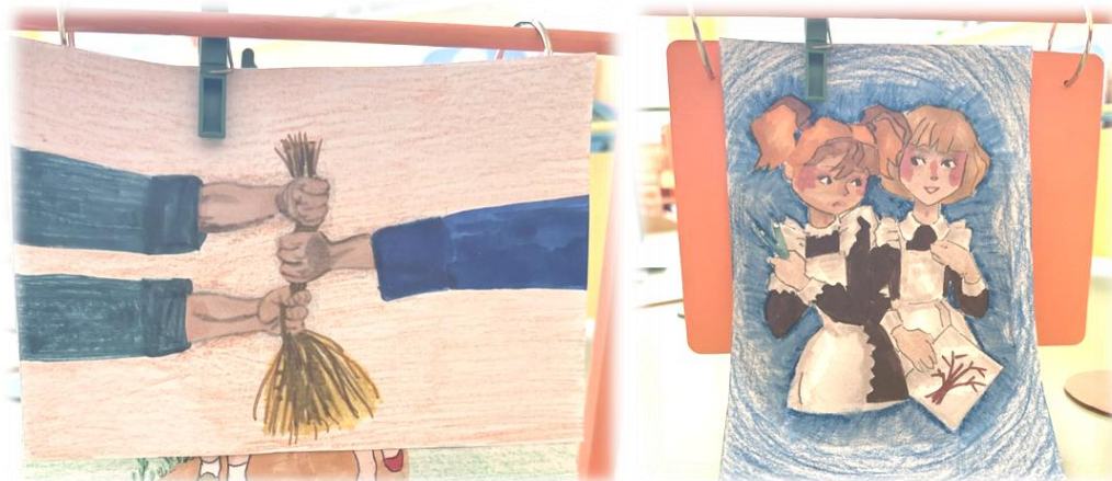
Рис. 2. Чтение

Во время недели «Наши добрые дела» читали и обсуждали рассказы «Волшебное слово», «Синие листья» В. Осеевой, повесть «Не буду просить прощения» С. Прокофьевой, сказки «Вежливые звери», «Волк, который учился вежливости» М. Александровой, «Ромашки в январе» М. Пляцковского, стихотворение «Вежливое слово» Э. Мошковской, сочинили свои сказки «В мире добрых слов», «Ни дня без волшебного слова», придумывали семейные сказки «Добро побеждает», «Лучики доброты» и т. д.