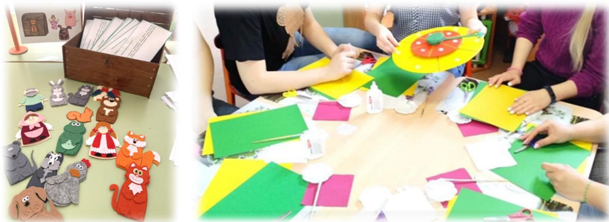
Рис. 5. Игра

Пятая часть – игра. Она позволяет раскрыть важнейшие ценности, формирует характер и развивает творческие способности. В календаре мы предлагаем несколько игр на выбор детей, в течение недели дошкольники знакомятся с несколькими народными играми, зарисовывают правила, придумывают свои варианты игры. Это могут быть и театрализованные игры, и игры-драматизации по прочитанным произведениям. Мастерская содержит последовательные схемы создания творческих работ, объявление о семейном мастер-классе или алгоритм для создания семейной работы. В течение недели «Мой любимый папа» создавали «Сундучок семейных игр» с любимыми играми детей и родителей, бабушек и дедушек. Во время недели «Наши добрые дела» создавали игры-ходилки для малышей, делали куклы для пальчикового театра, персонажей для театра теней, которые потом подарили воспитанникам других групп.