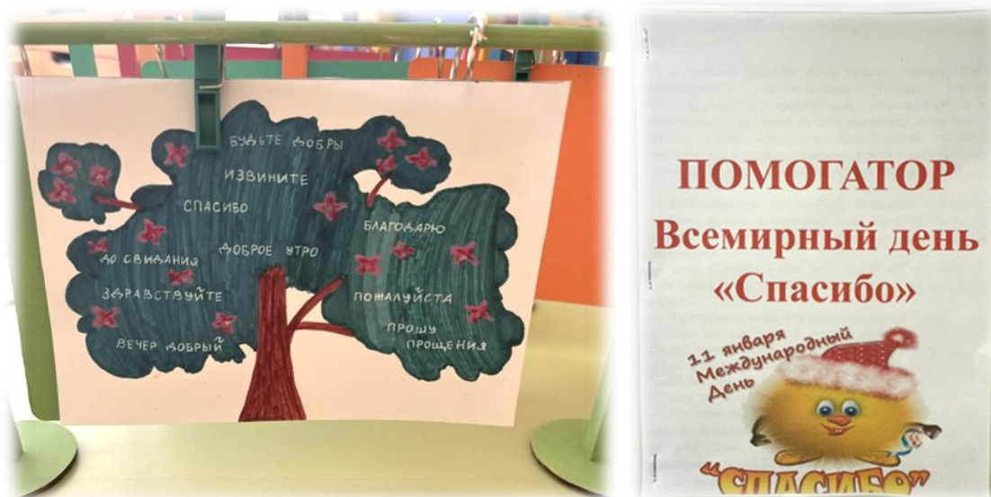
Рис. 1. Календарь события ко Дню «Спасибо» и «Помогатор»

Вторая часть календаря – чтение/слушание – знакомство с художественным произведением. Оно также осуществляется и дома, и в детском саду, особенно если произведений по данной теме несколько. Для родителей в «Помогаторах» разнообразные вопросы для беседы после прочтения произведения. Последовательность чтения (если произведений несколько) каждая семья выбирает самостоятельно. Обязательно предлагаем семьям принять участие в акции «Подвешенная книга»: выбрать самое интересное произведение, написать небольшие впечатления-рекомендации. В конце недели выбираем самую интересную книгу, делимся мнениями, вспоминаем яркие события из книги.