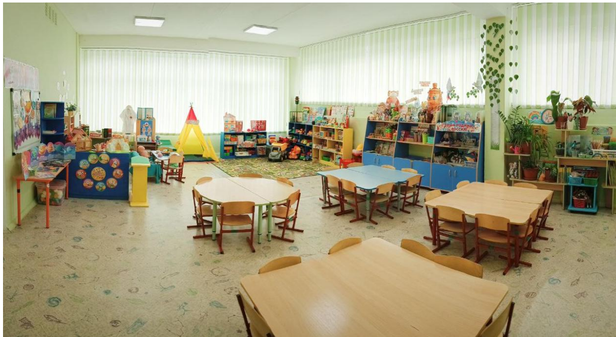
Рис. 1. Общий вид группы

Создание спокойной обстановки снижает тревожность детей и облегчает процесс общения. Пространство должно быть организовано таким образом, чтобы ребенку было удобно двигаться и ориентироваться.