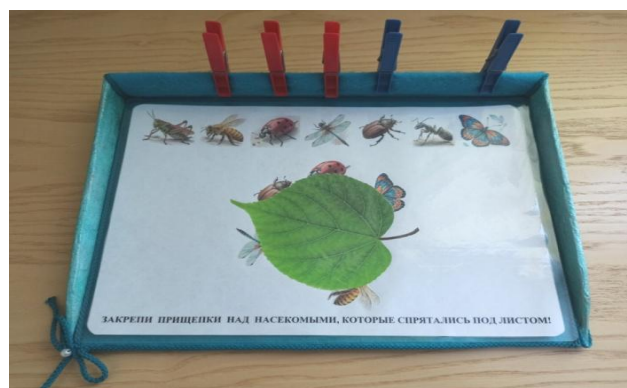
Рис. 3. «Кто спрятался?»

«Кто в каком домике живёт?». Взрослый выкладывает круги красного, синего, жёлтого и зелёного цвета под изображениями петуха, собаки, кота и жирафа. Ребёнку предлагается закрепить прищепку нужного цвета над домиком его обитателя, ориентируясь на часть изображения животного в окне.