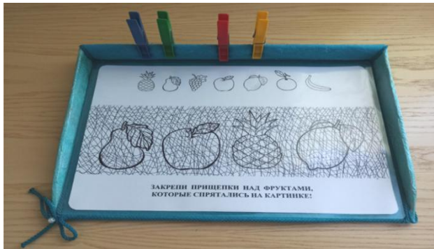
Рис. 6. «Что спряталось?»

«Найди, кто нарисован». Ребёнку предлагается найти на картинке спрятавшихся домашних животных и птиц и закрепить прищепки над соответствующими изображениями в верхней части листа (рис. 7).