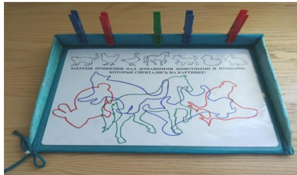
Рис. 7. «Найди, кто нарисован»

Работа с наборами прищепок разной степени жесткости позволяет развивать мелкую моторику, в частности щипковый захват для удержания пищащего предмета.