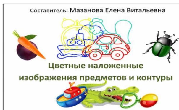
Рис. 9. Авторское пособие