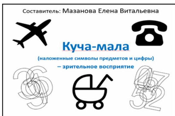
Рис. 8. «Куча-мала»

На логопедических занятиях применяем авторские альбомы по развитию зрительного восприятия на разных уровнях развития зрительного восприятия: предметном и символическом, позволяющие вести работу целенаправленно, поэтапно и системно, например «Куча-мала» (рис. 8) или картотеку предметов и их контуров (рис. 9). Игровые задания могут быть интегрированы в другие виды деятельности: развитие элементарных математических представлений, изобразительное искусство, окружающий мир.