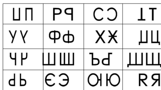
Рис. 11. «Волшебное зеркало»

Для обеспечения эффективности межпредметного взаимодействия необходимо: согласование терминологии (единые понятия «верх», «низ», «право», «лево»), регулярный обмен наблюдениями, недопущение дублирования функций, планирование коррекционной работы на основе диагностики, систематичность и краткость упражнений (5–7 минут ежедневно). Важно избегать перекладывания ответственности между специалистами. Ребёнок должен получать согласованную и последовательную помощь.