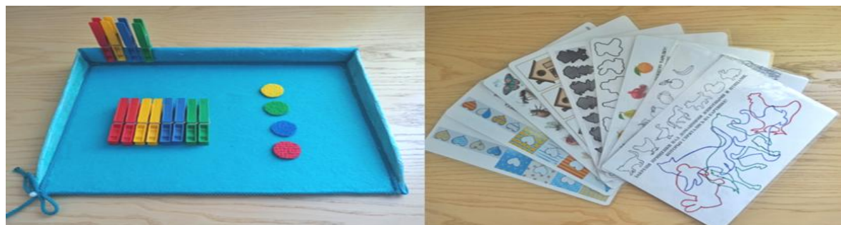
Рис. 1. Авторское пособие «Удивительные прищепки»

Задача педагога-психолога в работе по профилактике нарушений чтения и письма у будущих школьников в первую очередь заключается в развитии зрительного восприятия. Материал, который подбирает педагог-психолог, направлен на формирование фундамента, на котором в дальнейшем будет строиться письменная речь. В своей работе среди многих заданий по развитию зрительного восприятия детей в том числе используем задания из авторского пособия «Удивительные прищепки» (рис. 1).