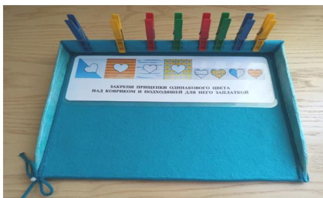
Рис. 2. «Найди нужную заплатку!»

«Кто спрятался?». Ребёнку предлагается закрепить прищепки над насекомыми, которые спрятались под листом, выбирая из множества предложенных насекомых в верхней части листа (рис. 3).