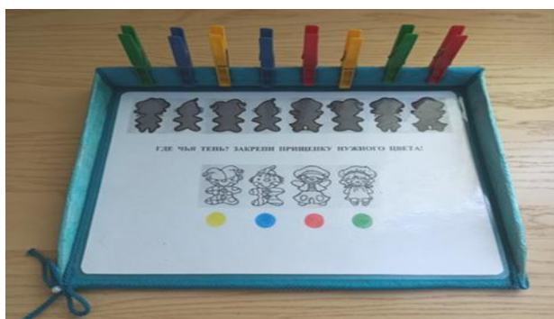
Рис. 4. «Где чья тень?»

«Где чей контур?». Ребёнок по просьбе взрослого закрепляет прищепку нужного цвета над контурным изображением игрушек в верхней части листа, ориентируясь на цвет круга под каждой игрушкой (рис. 5).