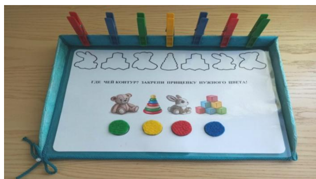
Рис. 5. «Где чей контур?»

«На какой тарелке лежит какой фрукт?». Ребёнку на начальном этапе предлагается, проводя пальчиком по дорожке, определить, на какой тарелке лежит какой фрукт, и закрепить прищепку нужного цвета над изображением фрукта в верхней части листа. На втором этапе ребёнок выполняет данное задание, проводя по дорожке глазами.